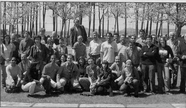
La final del certamen se celebró en Vigo.